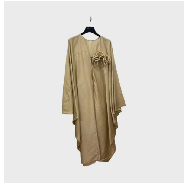
DRESS TUNICA DETTAGLIO INTRECCIO IN COTONE BEIGE