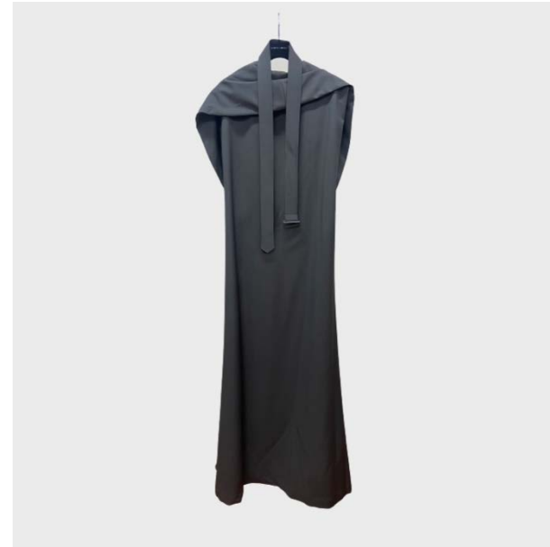
DRESS TUNICA CON SCOLLO DT IN LANA GRIGIO