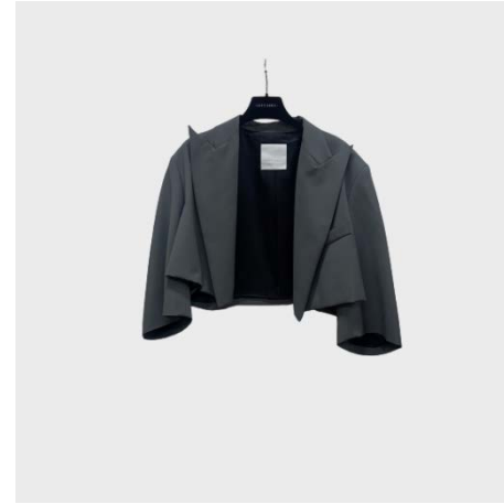
GIACCA CROP MANICA 34 IN LANA GRIGIO