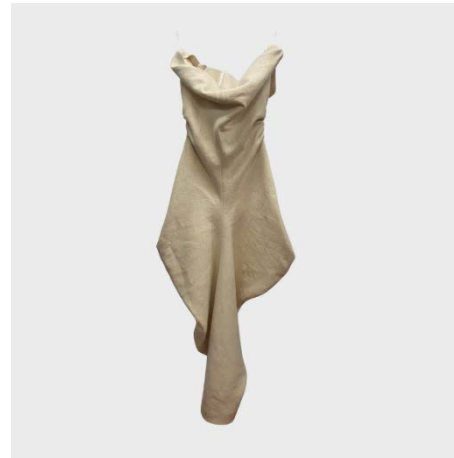
TUBINO DESTRUTTURATO IN LINO ECRU