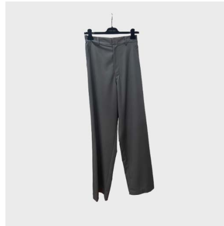
PANTALONE AMPIO ELASTICIZZATO IN LANA GRIGIO