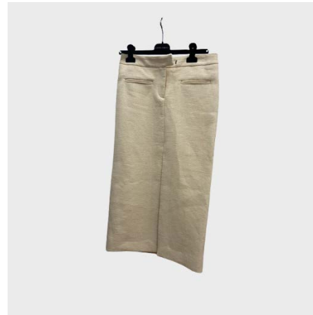
GONNA SPACCO DV IN LINO ECRU