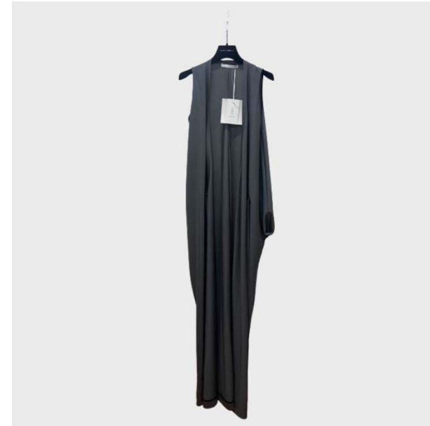
DRESS SM SCOLLO A V IN LANA GRIGIO