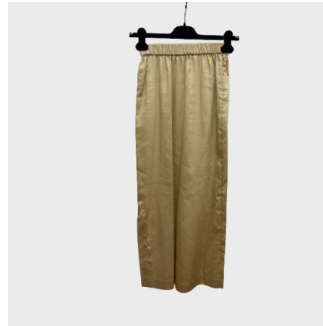
GONNA MIDI VITA ELASTICIZZATA IN COTONE BEIGE