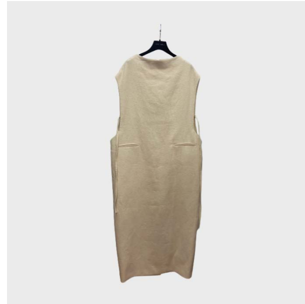
DRESS SM FIANCHI STRUTTURATI IN LINO ECRU