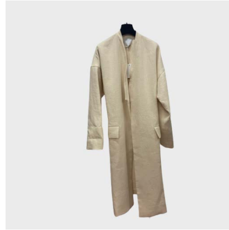
CAPPOTTO KIMONO ML IN LINO ECRU