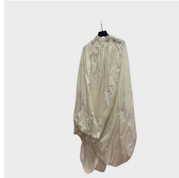
DRESS SM OVER COCOON ELASTICIZZATO GESSO