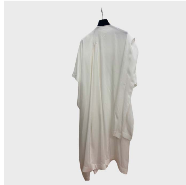
DRESS MANICA 3-4 OVERSIZE IN SETA BIANCO