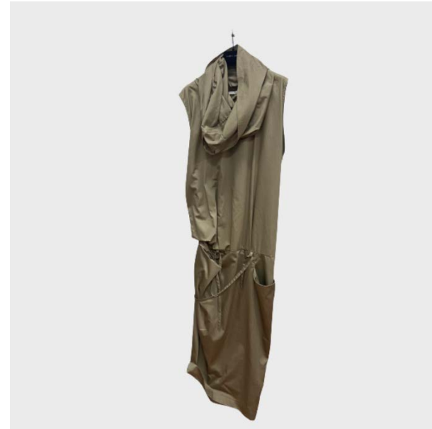
DRESS SM OVER DOLCEVITA IN COTONE GRIGIO SALVIA