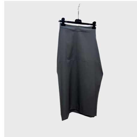
GONNA MIDI VOLUMI LATERALI IN LANA GRIGIO