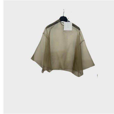
T-SHIRT OVERSIZE TRASPARENTE IN SETA OLIVA