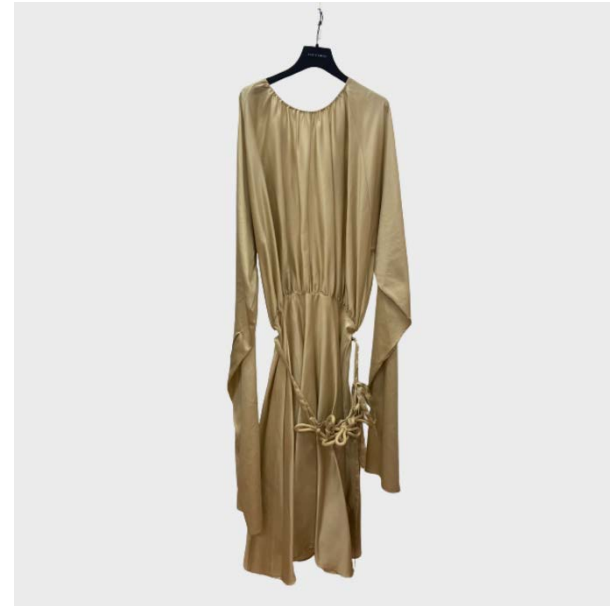
DRESS DETTAGLIO INTRECCIO CINTURA IN COTONE BEIGE