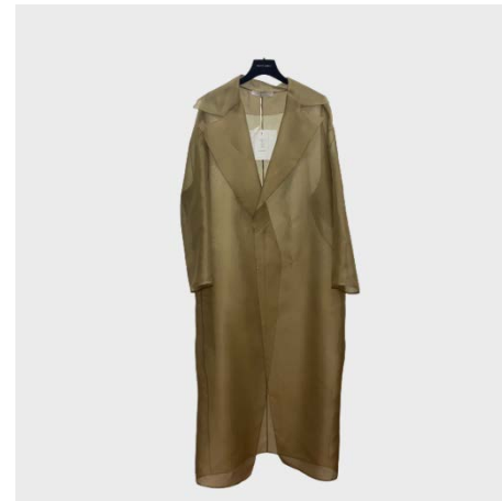
TRENCH ML OVERSIZE TRASPARENTE IN SETA OLIVA