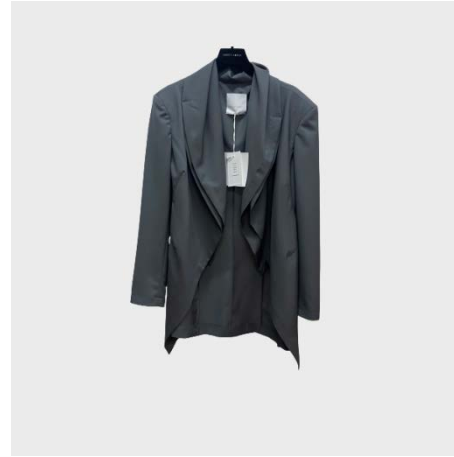
GIACCA DOPPIA REVER FLUIDO IN LANA GRIGIO