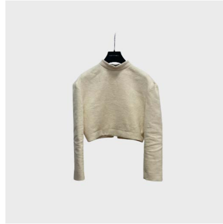
TOP ML DOLCEVITA IN LINO ECRU