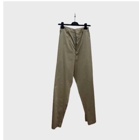
PANTALONI ELASTICIZZATI IN COTONE GRIGIO SALVIA