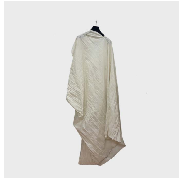
DRESS PARACADUTE SCOLLO A V GESSO