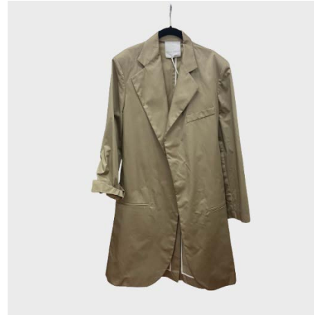
TRENCH ML 3 TASCHE IN COTONE GRIGIO SALVIA