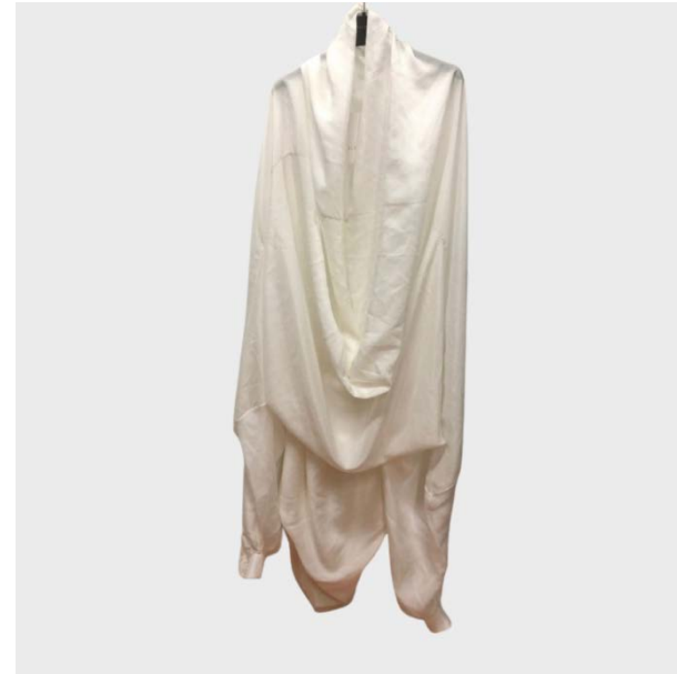
DRESS MANICA EXTRA DRAPPEGGIATO IN SETA BIANCO