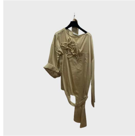
TOP ML DETTAGLIO INTRECCIO IN COTONE BEIGE